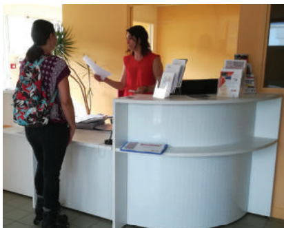
À l'accueil de l'Espace Grain de Sel, les bénévoles sont accompagnés.

Avec 72 associations de l'île adhérentes à l'Espace Grain de Sel, le centre social est un maillon essentiel dans la chaîne de solidarité construite par les bénévoles. En tant que point d'appui à la vie associative, le centre social les aide au quotidien : rédaction de statuts, prêt de matériel (sono, vidéo-projecteur, éclairage ou encore véhicule), reprographie et liens entre les actions et les missions.