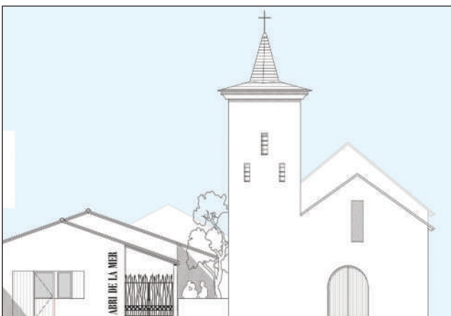
Esquisse de l'Abri de la mer et de la chapelle du Vieil.

La chapelle sera rénovée entièrement ainsi que la salle de l'Abri de la mer, en respectant les normes énergétiques en vigueur . Cela permettra d'offrir un confort aux usagers de la salle tout en réduisant la facture.