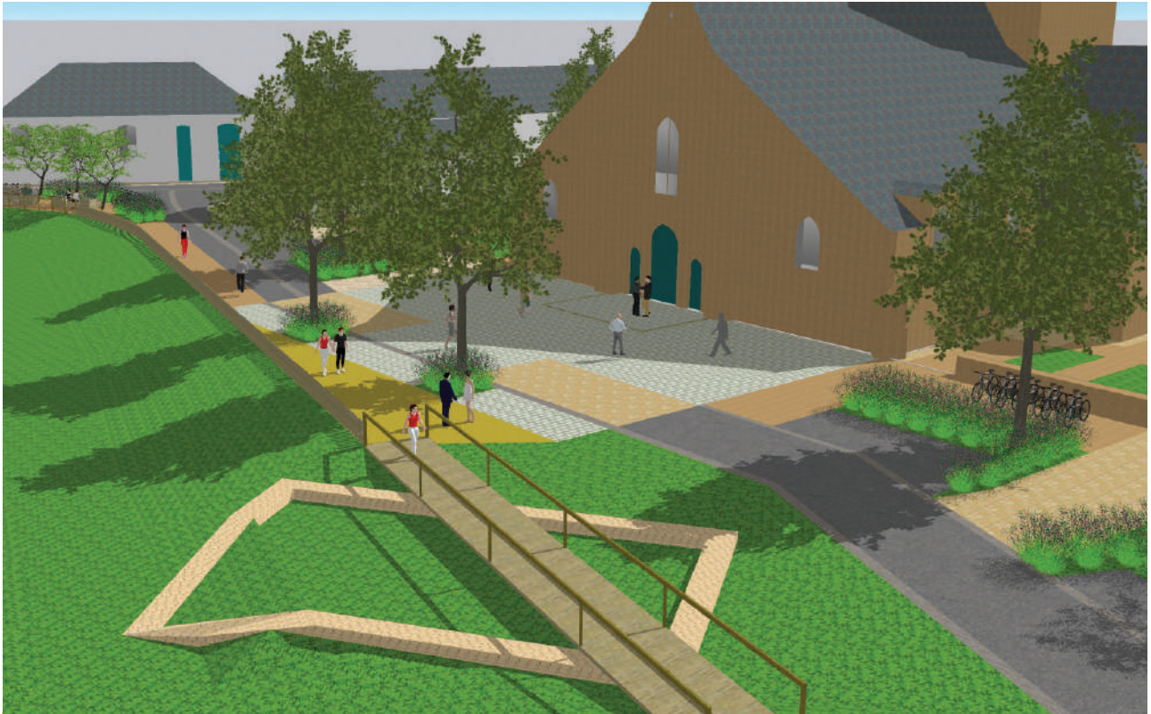
Projet d'aménagement de la rue de l'Église (image non contractuelle).

Le projet prévoit la création d'un parvis intégrant la végétalisation de la rue et l'aménagement d' une promenade piétonne autour du château . Celle-ci mettra en valeur l'ancienne emprise de l'accès historique à l'édifice. Des arbres seront plantés afin de créer un lieu de vie agréable. Des places de stationnement seront intégrées.